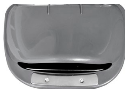
Detalle de la Chapa Apagacigarrillos