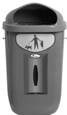
Beagle Bin Gris 50L